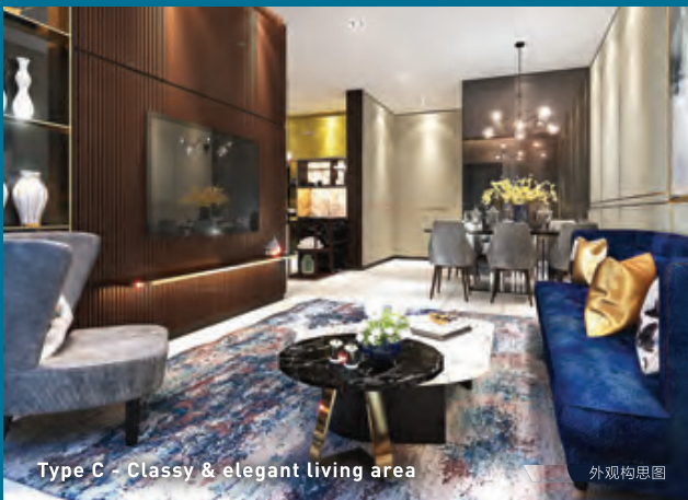
Type C - Classy & elegant living area