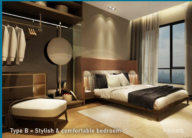
Type B - Stylish & comfortable bedroom