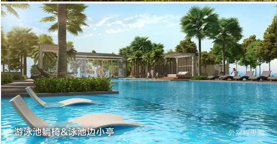
游泳池躺椅&泳池边小亭