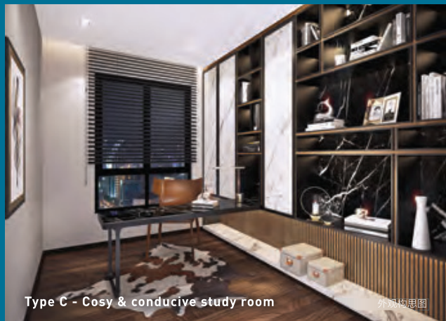
Type C - Cosy & conducive study room